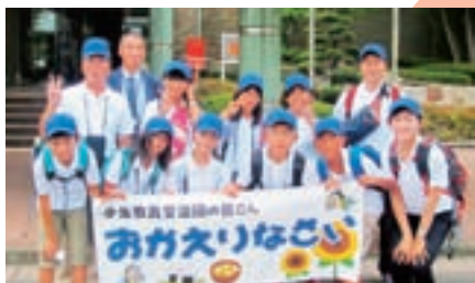
▲楽しい思い出がいっぱいできました

僕は「中国との食文化の違い、生活の違いを学んでくる」という目的でこの研修に参加しました。