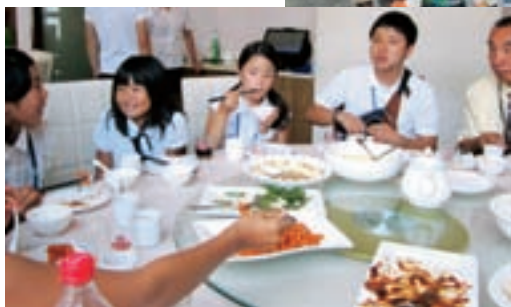
▲上海市内レストランにて円卓を囲んでの食事は和気あいあい