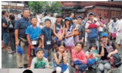
▲上海の豫園はたくさんの人で賑わっていました。