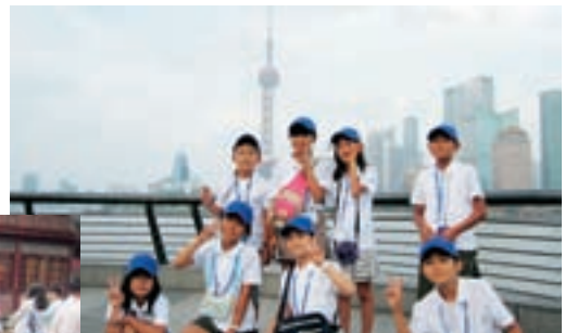
▲上海テレビ塔の大きさにびっくり

町内小学校5、6年生8人が中国の江西省南昌市や豊城市、上海市を訪れ、現地の小学生や雑技団とのふれあい、市街参観等を通じて教育交流を行いました。